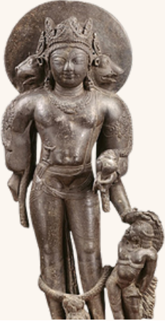
• काकाट साम्राज्य के समय की वेकुण्ठ विष्णु की प्रतिमा