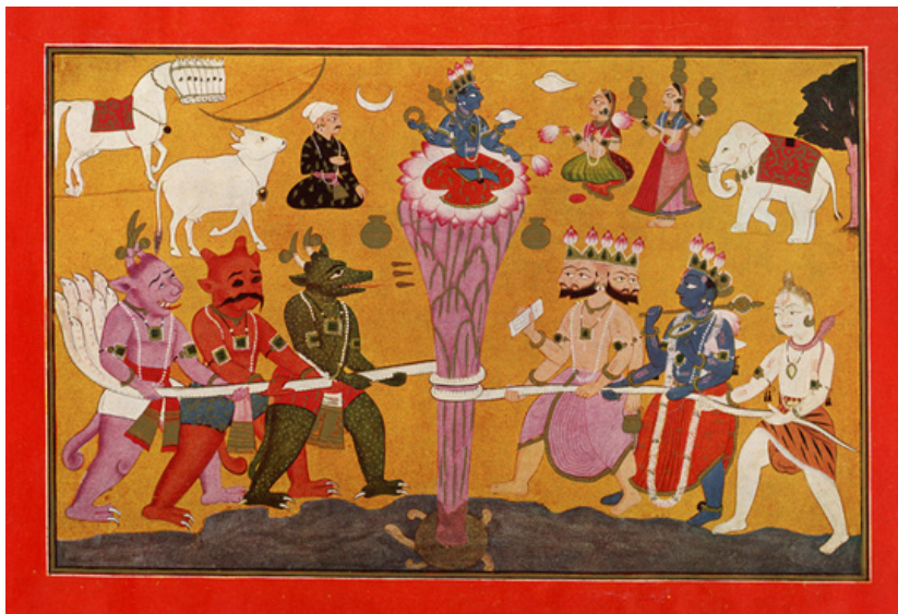
समुद्र मंथन का बशोली चित्र, वर्ष 1730 ई० का